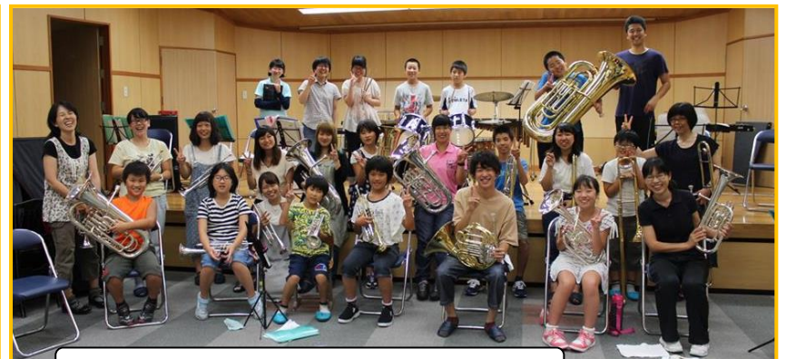
マンツーマンで、ていねいな都留文大生の指導