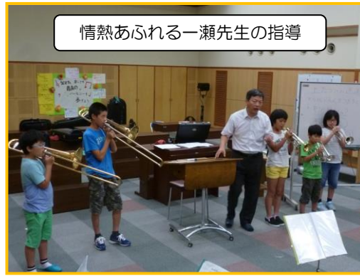
情熱あふれる一瀬先生の指導