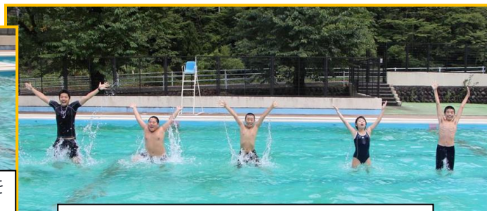
必見！6年生のウォーターボーイズポーズ！