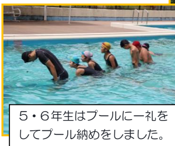
5・6年生はプールに一礼をしてプール納めをしました。

9月9日はプール納めでした。子どもたちには、今シーズンの泳力の認定証が渡されました。子どもたちの泳力が伸びたこと、何より安全にプール学習を終えることができました。