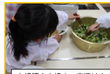
大好評！大根の一夜漬け！