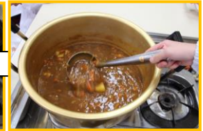
おいしいカレーのできあがり！