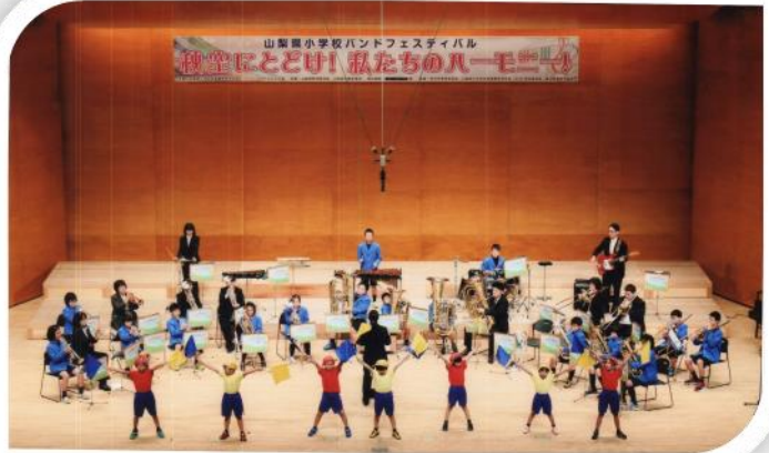
バンドフェスの模様は、12月23日（土・祝） 14：00より、テレビ山梨で放映されます

本日2学期の終業式を迎え、明日からは冬休みです。地域・保護者の皆様方には様々なご支援、ご協力をいただきまして、心から感謝を申し上げます。運動会、バンドフェスティバル、総合的な学習の発表、児童会選挙など、大きな行事の取組を通して、子どもたちは心や体も大きく成長し、よく頑張ることができたと思います。子どもたちには2学期のまとめをしっかりと、有意義な冬休みを迎えてほしいと思います。保護者の皆様には、子どもたちへのご指導をお願いいたします。